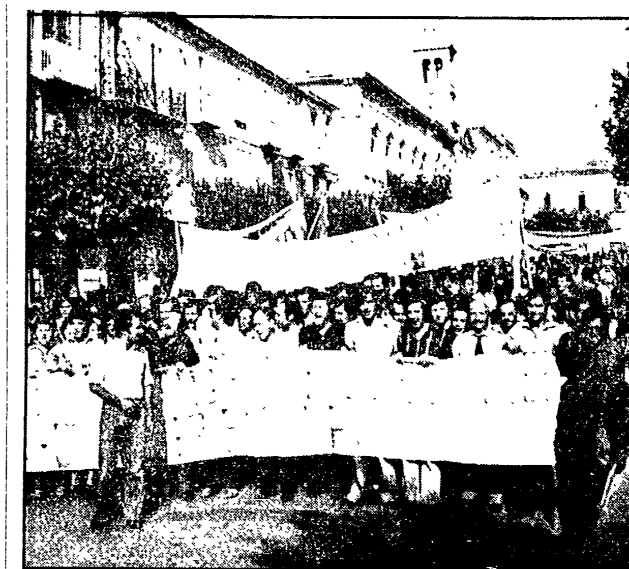
MARINA DI MELILLI - L'intero abitato vive con l'incubo dell'inquinamento