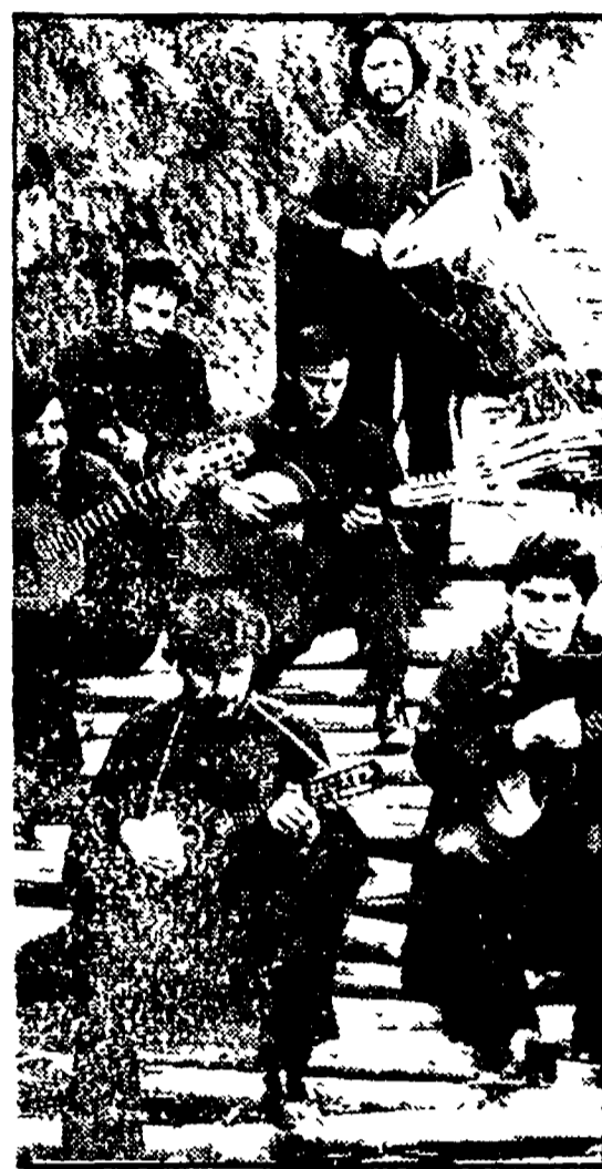
IL COMPLESSO «INTI ILLIMANI»