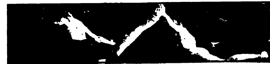
I «DANZATORI SCALZI»