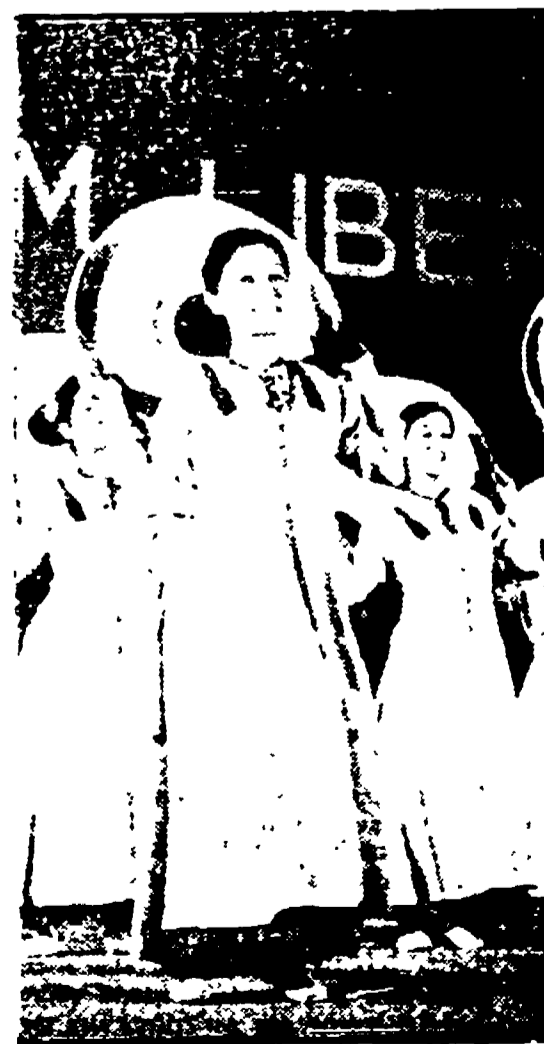
IL BALLETO DEL VIETNAM

PALCO CENTRALE, ore 22 — Spettacolo folkloristico con gruppi dell'Eritrea e del Vietnam.