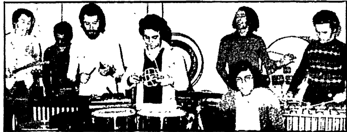
IL COLLETTIVO DEL CONSERVATORIO DI S. PIETRO A MAJELLA

PALCO CENTRALE, ore 22 — Spettacolo con Napoli Centrale e Il Baricentro.