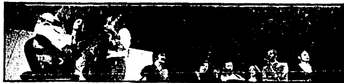
IL NUOVO CANZONIERE ITALIANO

PALCO CENTRALE, ore 22 — Il Nuovo Canzoniere Italiano in « Fiaba grande ».