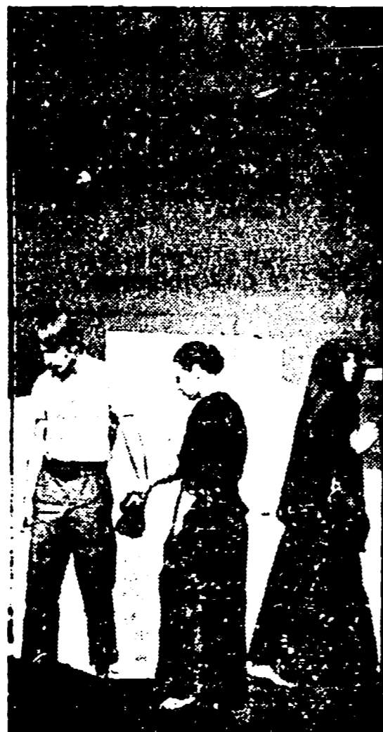
IL « BERLINER ENSEMBLE » IN « I FUCILI DELLA SIGNORA CARRAR »

PALCO CENTRALE, ore 22,00 — Rassegna del jazz in Italia: i gruppi O.M.C.I. e Unità Musicale.