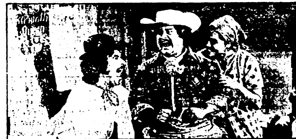
Il Teatro Campesino presenta « La carpa de los rasquachis »

PALCO CENTRALE, ore 22,00 — Spettacolo di un gruppo folk-oristico bulgaro.