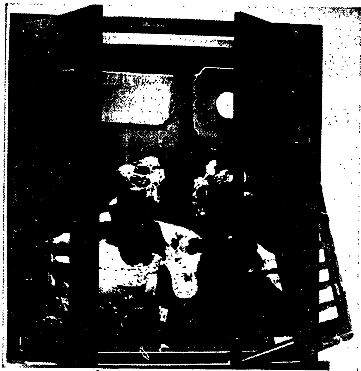
Luciano Minguzzi: «I coniugi del n. 7», 1971 (legno e bronzo).

Come un Paese ricco di risorse e di tradizioni culturali, oppresso e sfruttato dal centralismo autoritario dello Stato costruito dai franchisti, prepara il proprio riscatto - Il processo unitario in corso fra tutte le forze antifasciste - A colloquio con Santiago Alvarez, segretario generale del PCG - «Non siamo un partito delle catacombe e non abbiamo la vocazione alla clandestinità»