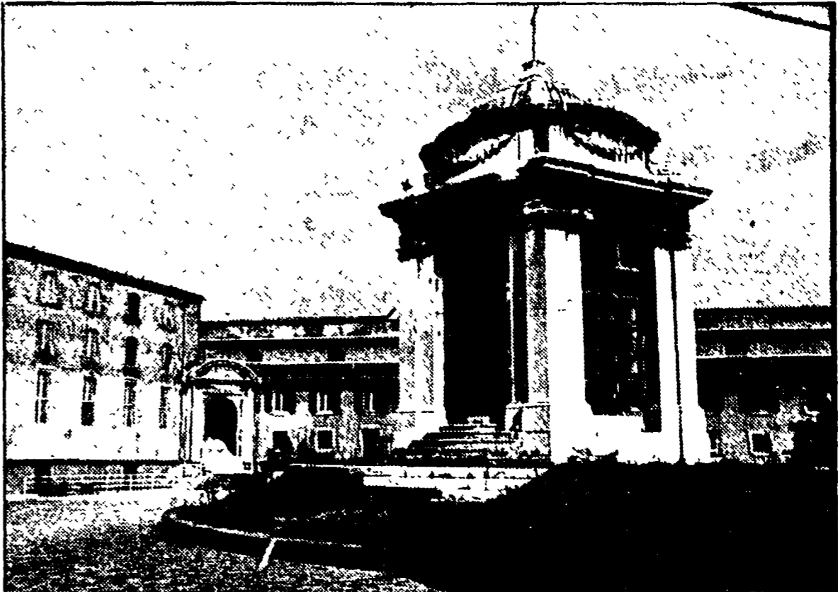
La Mole Vanvitelliana ad Ancona, un'immagine della corte interna

L'odissea degli ultimi 2 secoli: da carcere a magazzino tabacchi attraverso numerose tappe intermedie - Nel 1958 gli ultimi scempi del meraviglioso piazzale interno