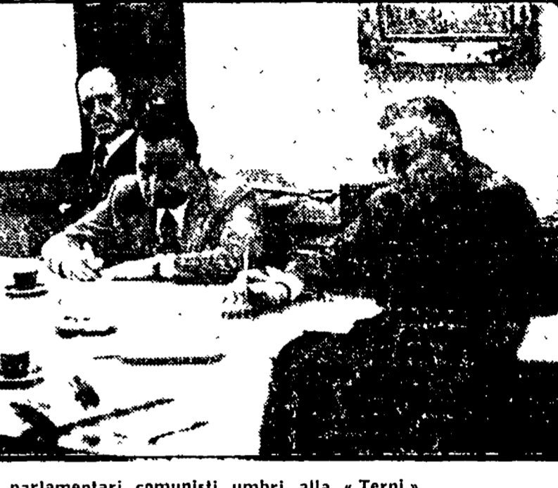
Due momenti della visita dei parlamentari comunisti umbri alla «Terni»