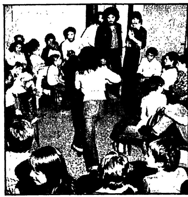
Incontro studenti-genitori alla media «Donatello»