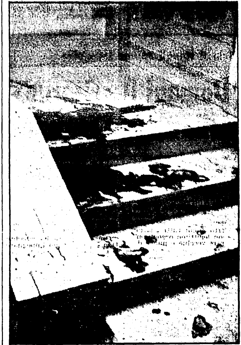
Macchie di sangue sul pianerottolo dell'agenzia assicurativa

Contro la politica suicida della Finmeccanica a Napoli