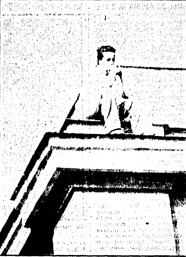
Lo sciopero indetto dagli autonomi della CISAL ha colpito pesantemente i degenzi. Proprio per protestare contro l'azione irresponsabile del sindacato autonomo una donna, ricoverata al Cardarelli, si è arrampicata ieri su un cornicione dell'ospedale, rimanendovi per molto tempo.