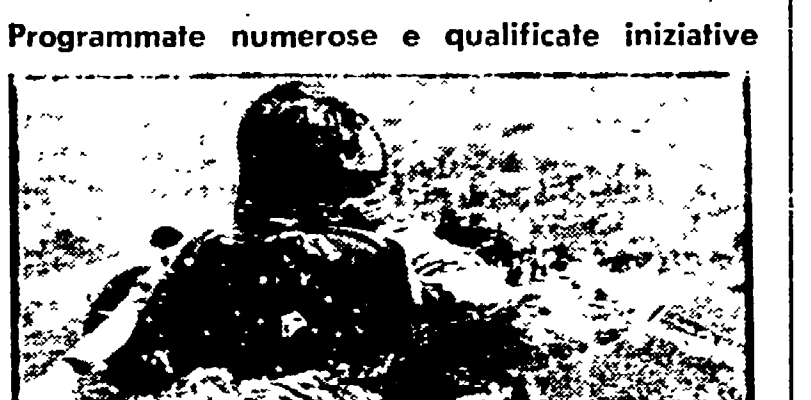
Vasil Lazaev, comandante della «Soyuz-12» durante una prova in mare in caso di atterraggio su una superficie d'acqua. L'astronauta sarà presente all'inaugurazione della «mostra spaziale» a Cagliari.

Programmate numerose e qualificate iniziative