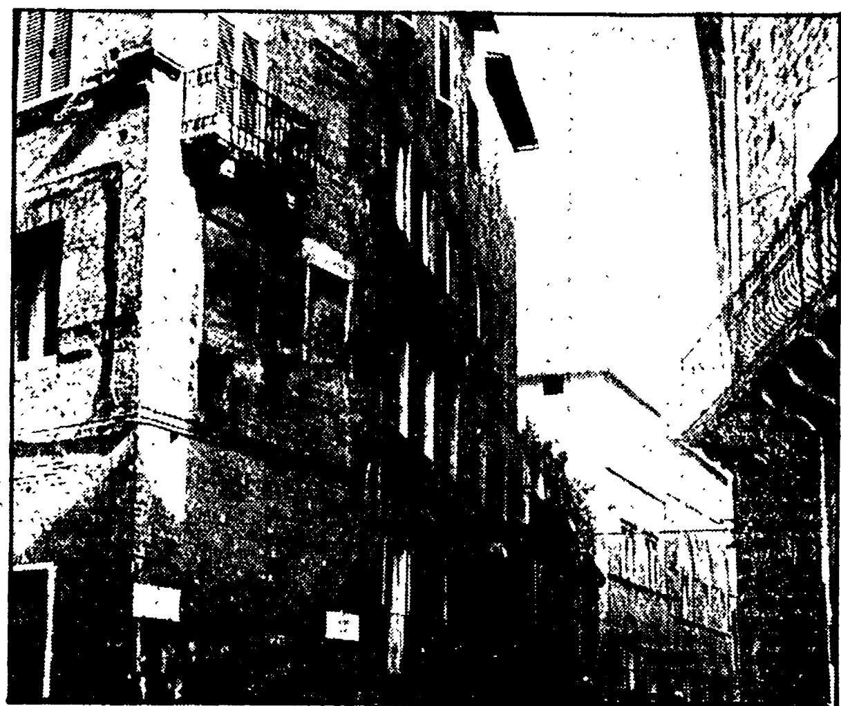
Uno scorcio del centro storico di Siena

SIENA, 5. Scadeva proprio ieri il termine valido per la presentazione da parte dell'Amministrazione comunale di Siena alla Regione, del primo programma di risanamento di un rione del centro storico cittadino. La Giunta ha rispettato le scadenze imposte dalla legge speciale e si è presentata al Consiglio con un progetto di intervento sul quartiere del Bruco. La discussione sull'argomento, che si è svolta con un progetto di intervento sul quartiere del Bruco. La discussione sull'argomento, che si è svolta con un progetto di intervento sul quartiere del Bruco.