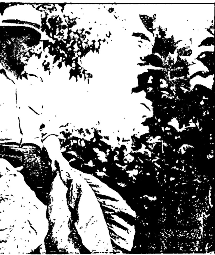
Il tabacco umbro rischia di non trovare più sbocchi adeguati sul mercato, se non venisse rivista dalla CEE la decisione di importare grossi quantitativi di prodotto estero