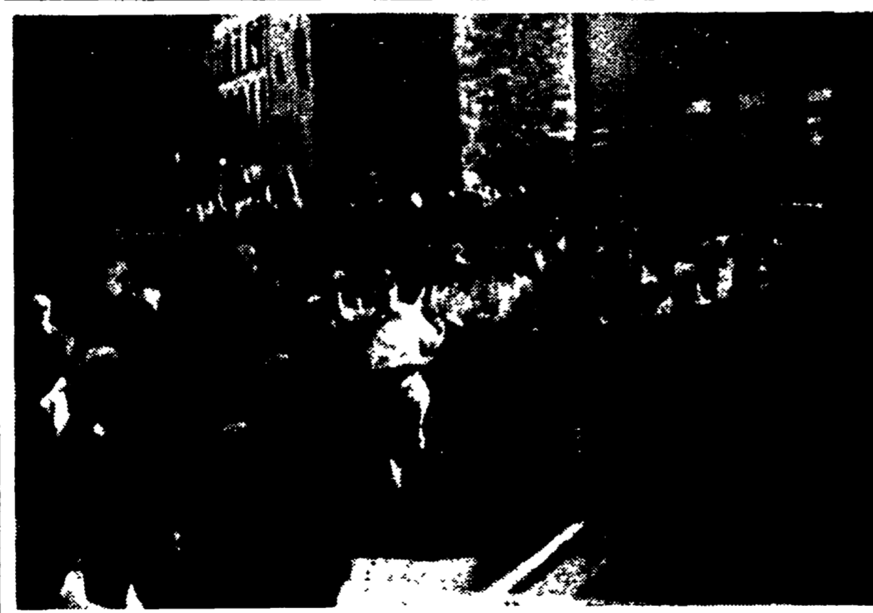
FIRENZE — Sfilata del corso dei combattenti di Spagna per la via del centro storico. In primo piano la bandiera della brigata americana Abraham Lincoln.

La votazione sarà ripetuta giovedì: così ha stabilito un «vertice» dei dirigenti del partito - Molti assenti e 19 schede bianche - Discorso di Andreotti - Il dibattito al CN ha confermato la mancanza di un impegno adeguato sui temi della crisi