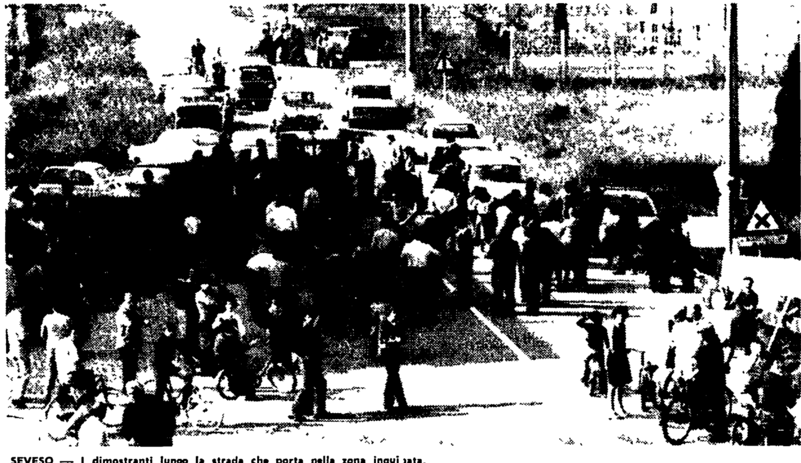
SEVESO — I dimostranti lungo la strada che porta nella zona inquata.

La «settimana non allegra per nessuno», come l'ha definita Andreotti nel messaggio al Paese, avrà quasi sicuramente — dicevamo — una sua apoteosi nella riunione di venerdì del Consiglio dei ministri.