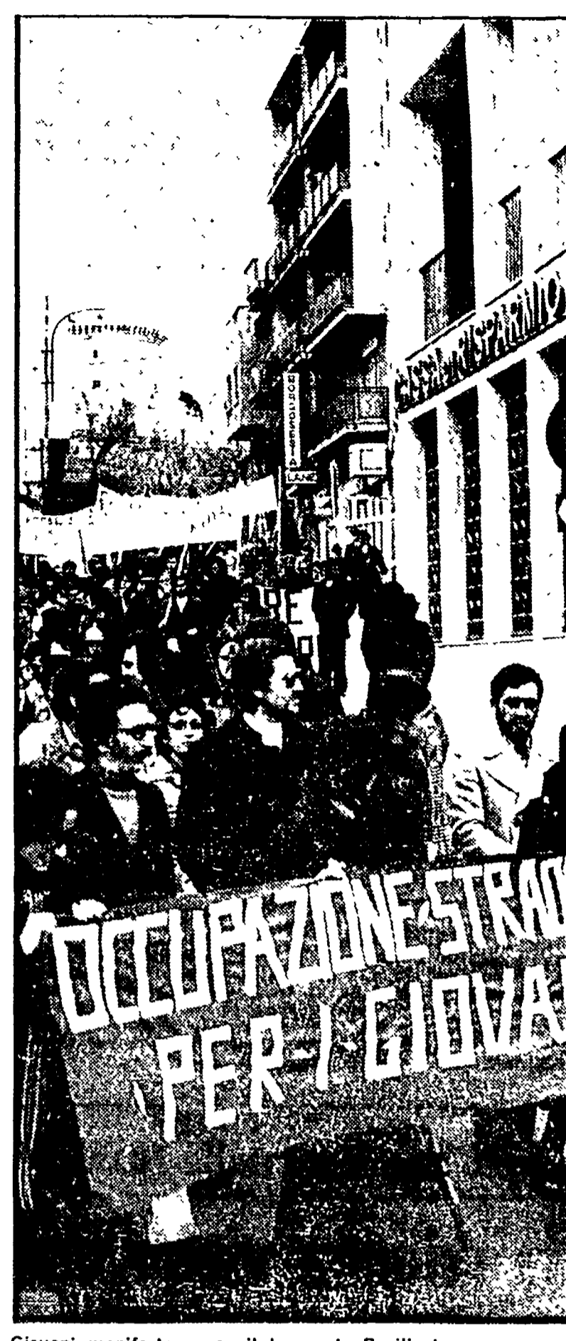
Giovani manifestano per il lavoro in Basilicata