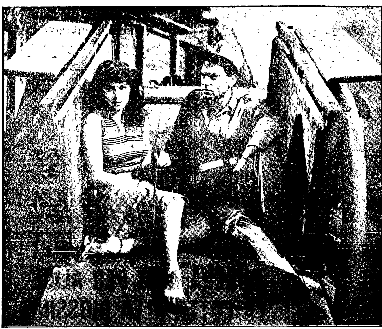
Silvana Mangano e Raf Vallone in una scena di «Riso amaro» di Giuseppe De Santis