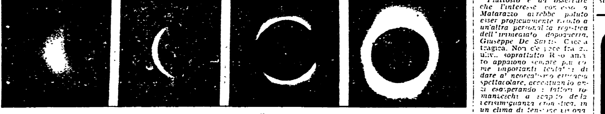
L'eclissi di sole, nelle sue varie fasi, colta dalla televisione australiana

La prossima si avrà nel 2020 - Il disco dal sole è rimasto completamente nascosto per circa tre minuti - Folla di astronomi nel piccolo villaggio di Bombala