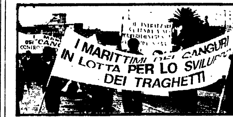
Una manifestazione a Cagliari dei marittimi dei «Canguri»

«Eppure la legge 12 giugno 1962 n. 588 (primo piano di rinascita della Sardegna) prevedeva all'art. 12, per le merci trasportate dal servizio traghetto, il pagamento della tariffa ferroviaria».