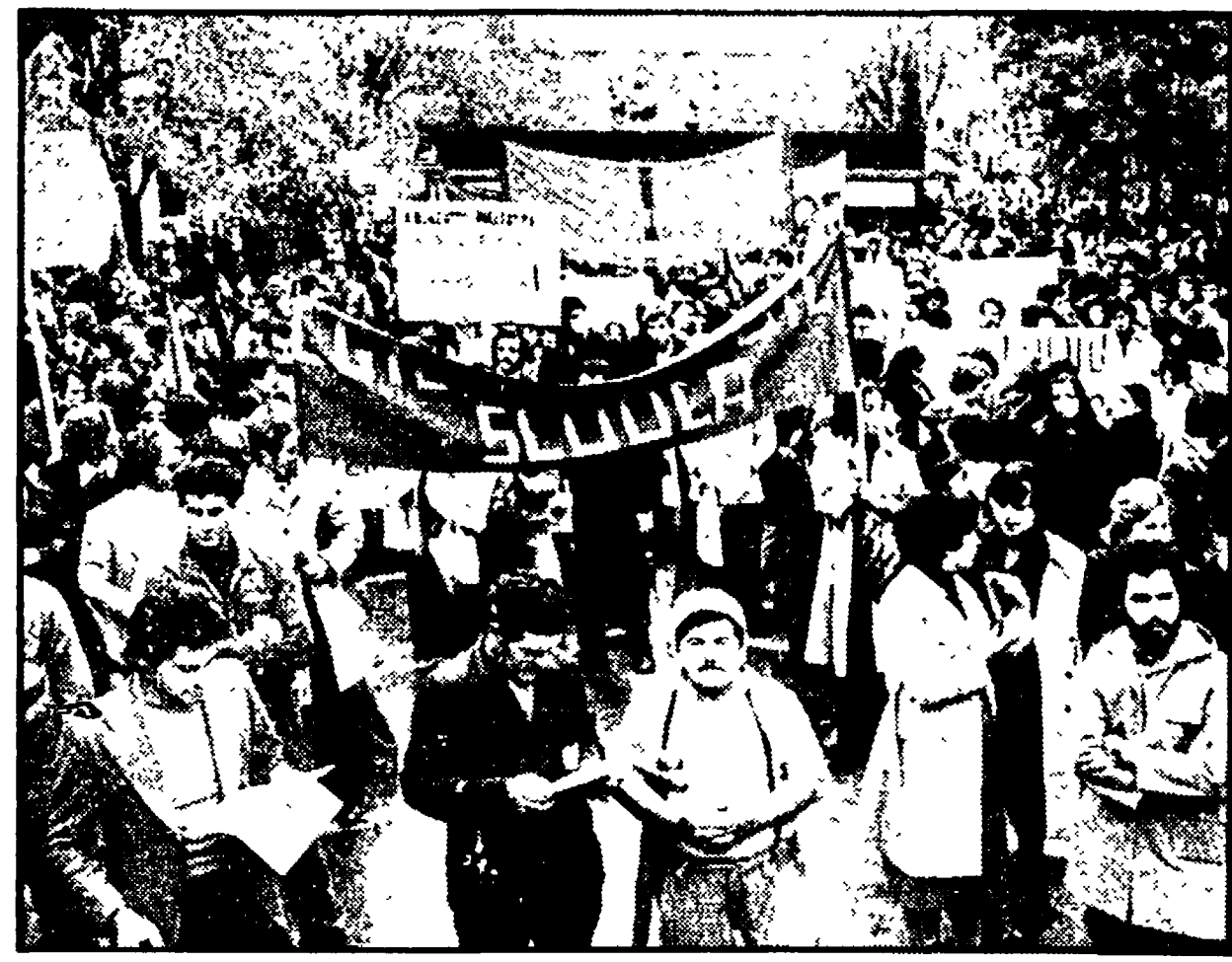
Un momento della manifestazione di ieri ad Ancona