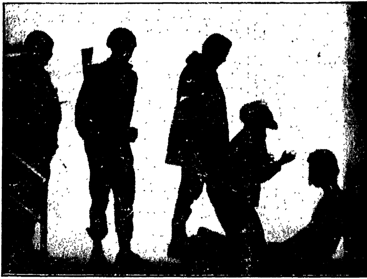
Una visione dello stadio di Santiago ridotto in lager dalla giunta assassina di Pinochet. La foto mostra agenti della DINA, la ferrea polizia segreta dei golpisti, mentre torturano due patrioti uno dei quali ingocciolato sta pregando. In questo stadio secondo la «Libertas» i nostri azzurri dovrebbero andare a giocare la finale di «Davis»

«L'assemblea Generale delle Nazioni Unite, l'UNESCO, l'OIT, il CEPAL, la FAO, l'OSA, il Parlamen-