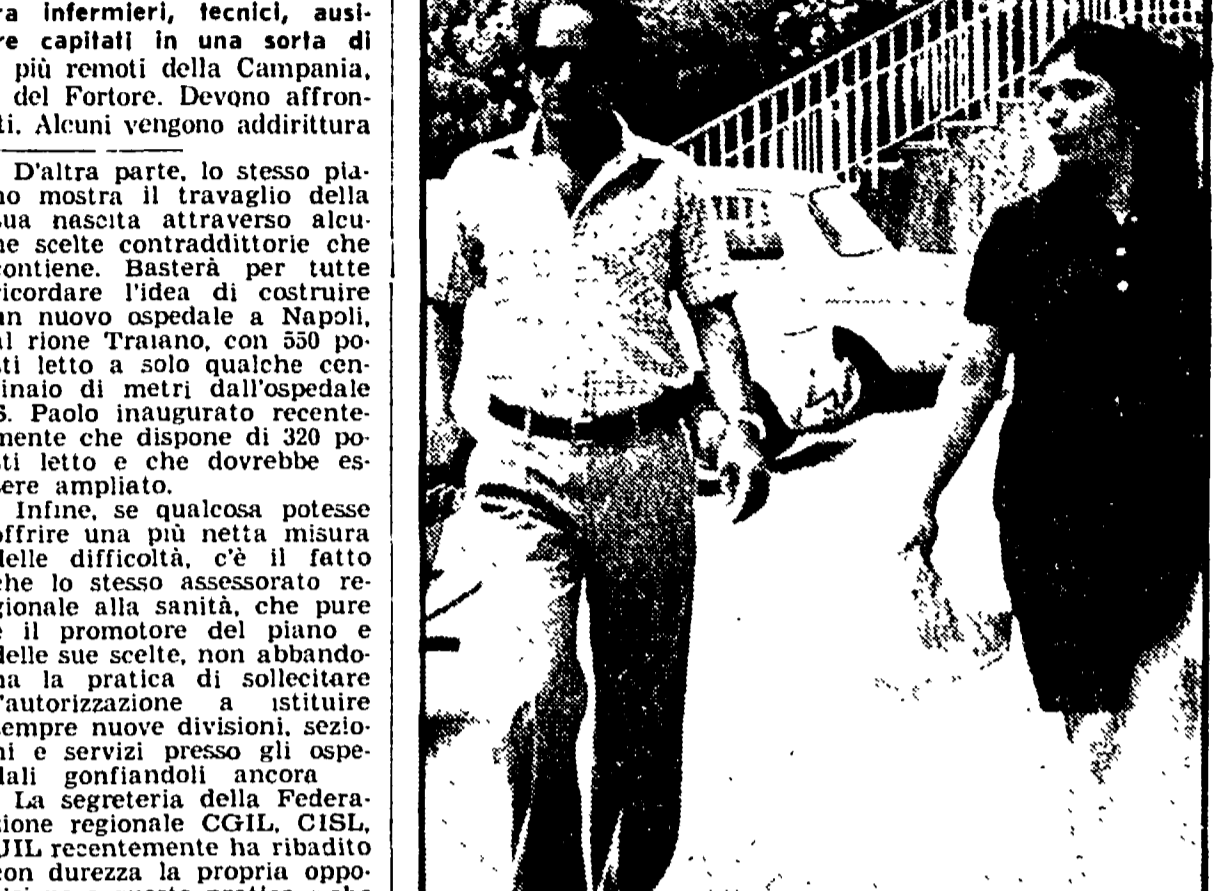
Sono centinaia i pazienti che ogni giorno vengono dalle zone interne a ricoverarsi negli ospedali napoletani. Alla origine di questo «urbanesimo sanitario» c'è la mancanza di strutture periferiche e la convinzione che qui le cose vanno meglio. Nella foto una scena consueta: dopo un lungo viaggio finalmente sarà possibile visitare il parente ammalato