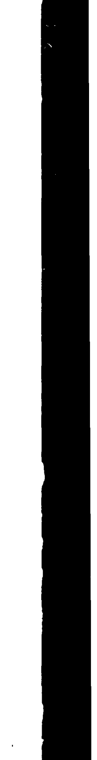
Un candidato comunista per un seggio di un'assemblea locale (il secondo a destra) diffonde e discute, nella prefettura di Kagoshima, con alcuni elettori il giornale del partito «Akhaha»