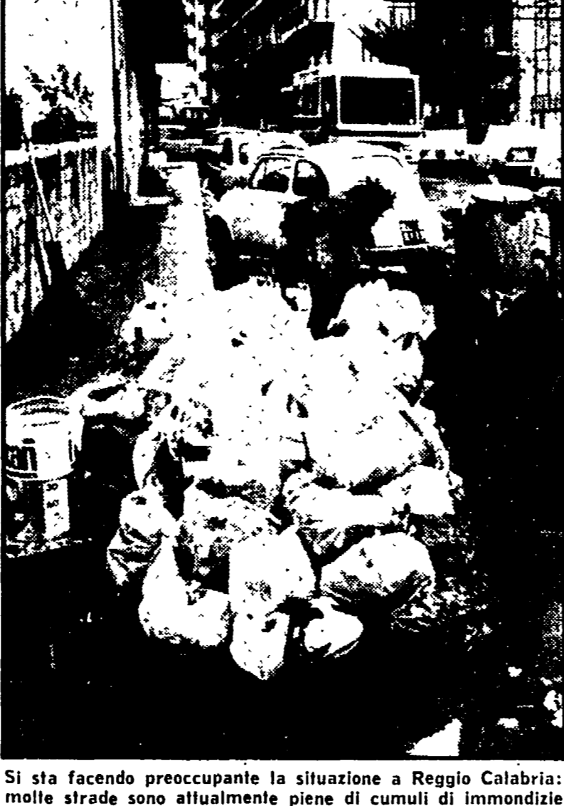
Si sta facendo preoccupante la situazione a Reggio Calabria: molte strade sono attualmente piene di cumuli di immondizie

Per quanto riguarda la situazione politica la settimana passata ha fatto registrare qualche progresso nella questione delle elezioni dei rappresentanti della regione.