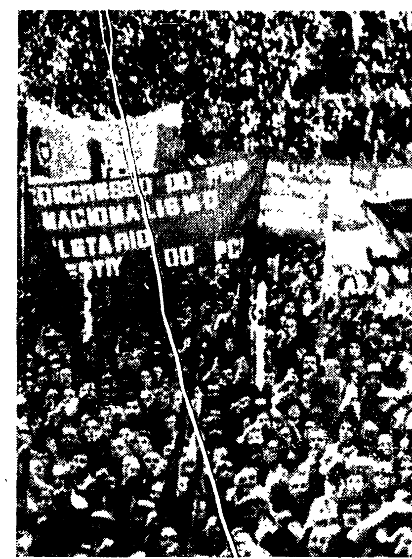
LISBONA - Uno scorcio dell'enorme folla che ha partecipato alla manifestazione di chiusura dell'8° Congresso del PCP nell'arena di Campo Pequeno.