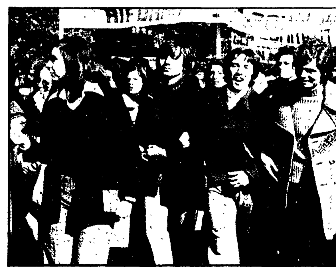
Una recente manifestazione studentesca a Siena

Lo Stato spende molto per interventi «a pioggia» che finiscono per andare anche a chi in effetti non ne ha molto bisogno - «Fotografia» dell'assegnazione dei pre-salari e dei posti letto nell'Ateneo toscano