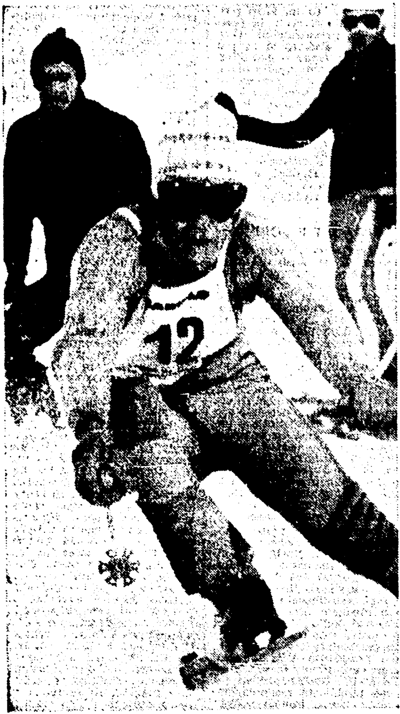
LIVIGNO — Ingemar Stenmark in azione durante il vittorioso slalom di Livigno.

Dietro allo svedese si sono classificati i soliti Gros e Thoeni - Quarto Franco Bieler, quinto Paolo De Chiesa, settimo Diego Amplatz - Oggi attesa rivincita con la disputa dello slalom gigante