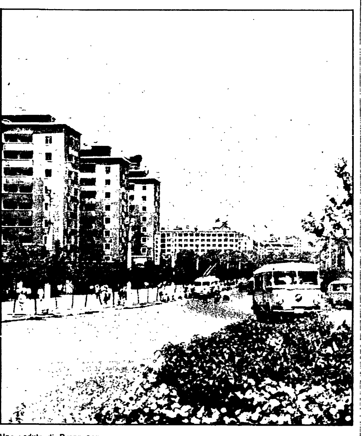
Una veduta di Pyongyang