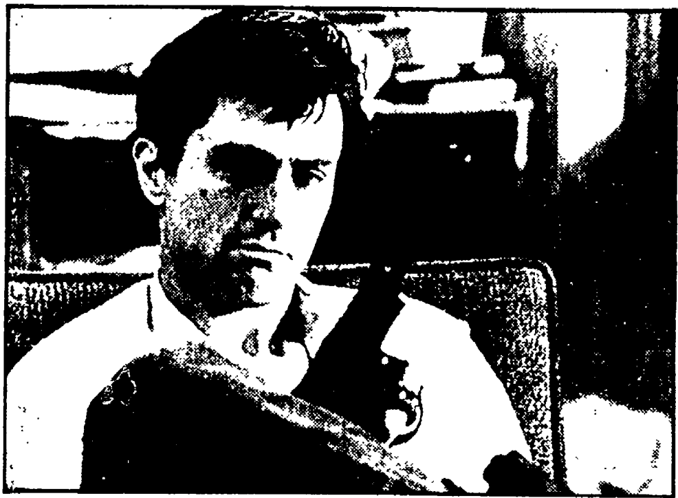
Robert De Niro in «Taxi driver»

Una denuncia disillusa ma puntuale della violenza che domina i rapporti sociali e il loro codice di valori