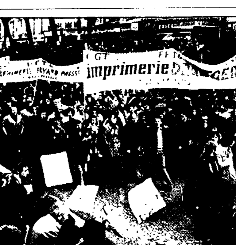
Altre 24 ore di sciopero proclamate dal sindacato tipografico

Una sottile distinzione terminologica dovrebbe portare al restringimento della commissione per il negoziato con il governo - Brandt ricevuto dal primo ministro