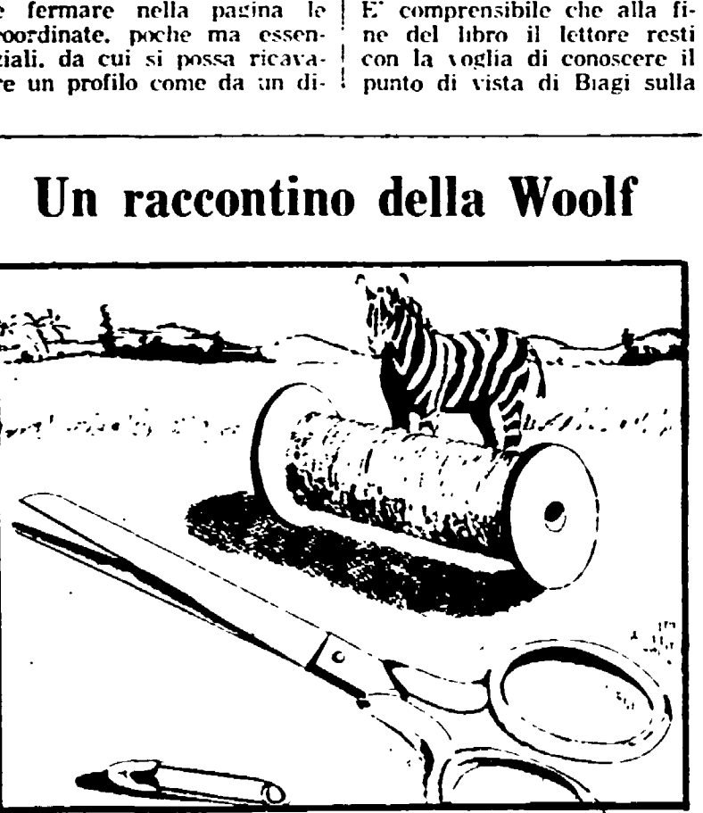
La Emma edizioni ha pubblicato in questi giorni «Il distate d'oro» un delicato racconto per bambini della grande scrittrice inglese Virginia Woolf...