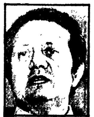
SOARES - Un governo contestato.