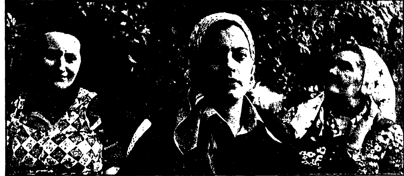
Malgrado i numerosi tentativi degli agrari di dividere le lavoratrici che hanno alle spalle una lunga tradizione di lotta, proseguono le battaglie per ottenere non solo migliori condizioni di lavoro, ma anche la garanzia dell'occupazione