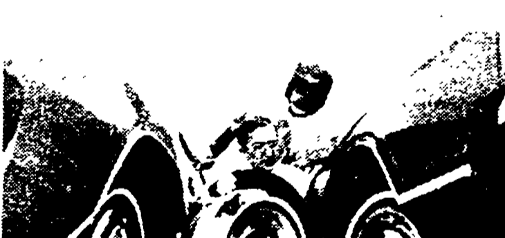
Così si presentano dopo una foratura un radiale normale (a sinistra) e un radiale con il dispositivo Goodyear (a destra).

Anche la Goodyear ha messo a punto un dispositivo per pneumatici che consente all'automobilista di non interrompere la marcia quando si verifica una foratura. Il dispositivo, denominato «Run flat tire», può essere usato su qualsiasi pneumatico radiale quale blocchi lo sgonfiamento.