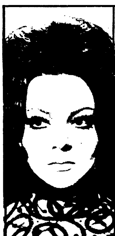
MADRID. La cantante spagnola Sarita Montiel ha respinto l'invito di partecipare al Festival internazionale...

La posizione assunta dall'ICI merita di essere attentamente valutata... Sarita Montiel non va in Cile