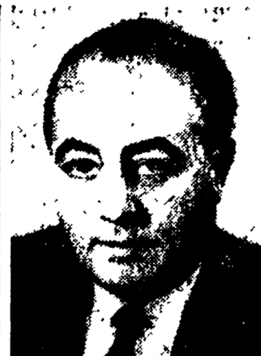
Jean de Broglie

PARIGI, 26 dicembre. Un misterioso delitto è avvenuto la vigilia di Natale nella capitale francese. La vittima è il noto deputato giscardiano Jean de Broglie, che aveva ricoperto nel passato numerosi incarichi governativi. L'assassino, stando all'elenco ai testimoni, sarebbe un giovane non più che ventenne, vestito con un maglione o del «blue jeans». Sempre secondo le prime testimonianze, de Broglie avrebbe vissuto tranquillamente per diversi minuti con il giovane prima di essere abbattuto con tre colpi di pistola sul marciapiede di rue des Dardanelles, davanti al numero 5.