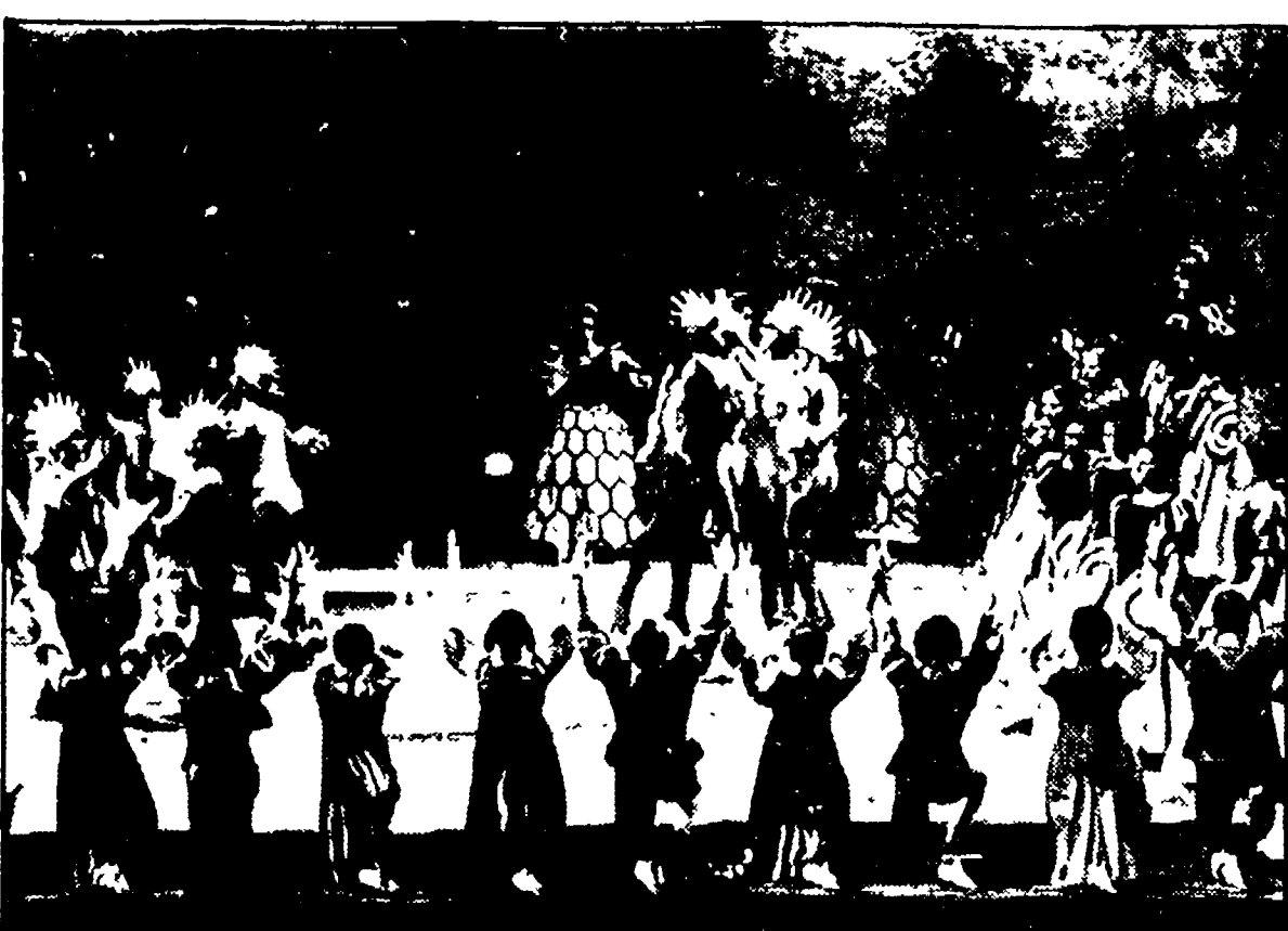
Una scena dell'opera di Mercadante

La nuova opera di Saverio Mercadante (1795-1870), si è inaugurata ieri la stagione lirica romana. Per il Teatro dell'Opera è insolita la data (28 dicembre) e, soprattutto, insolito è l'autore prescelto per l'inaugurazione.