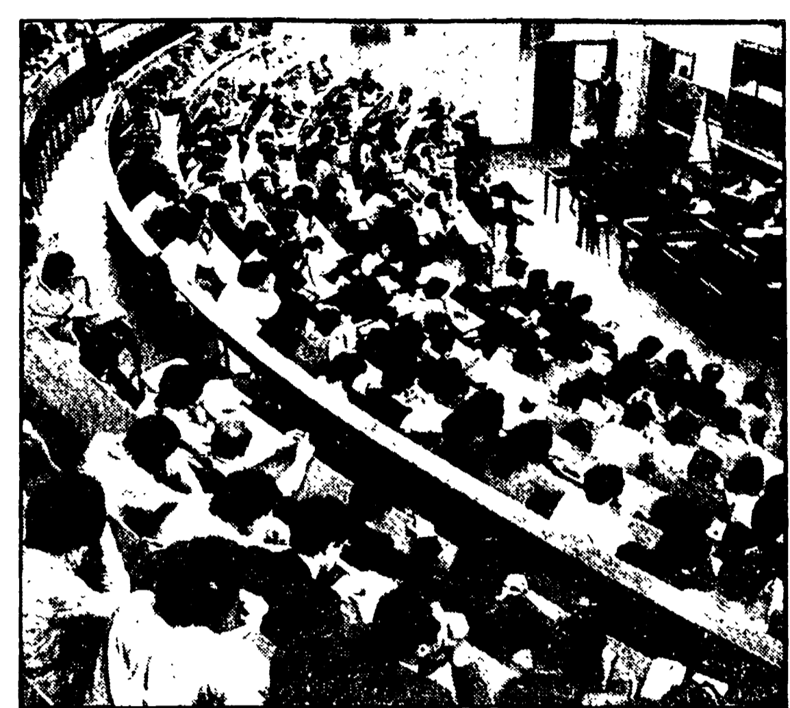
Alcune immagini della presentazione alla Camera della proposta di legge del PCI di riforma universitaria...