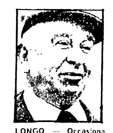
LONGO — Occasione per il rinnovamento