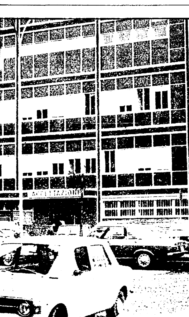
Il nuovo reparto Accettazione all'ospedale civile di Pescara

« La nostra lettera è un grido di dolore che si rialza dal cuore di tutti noi... »