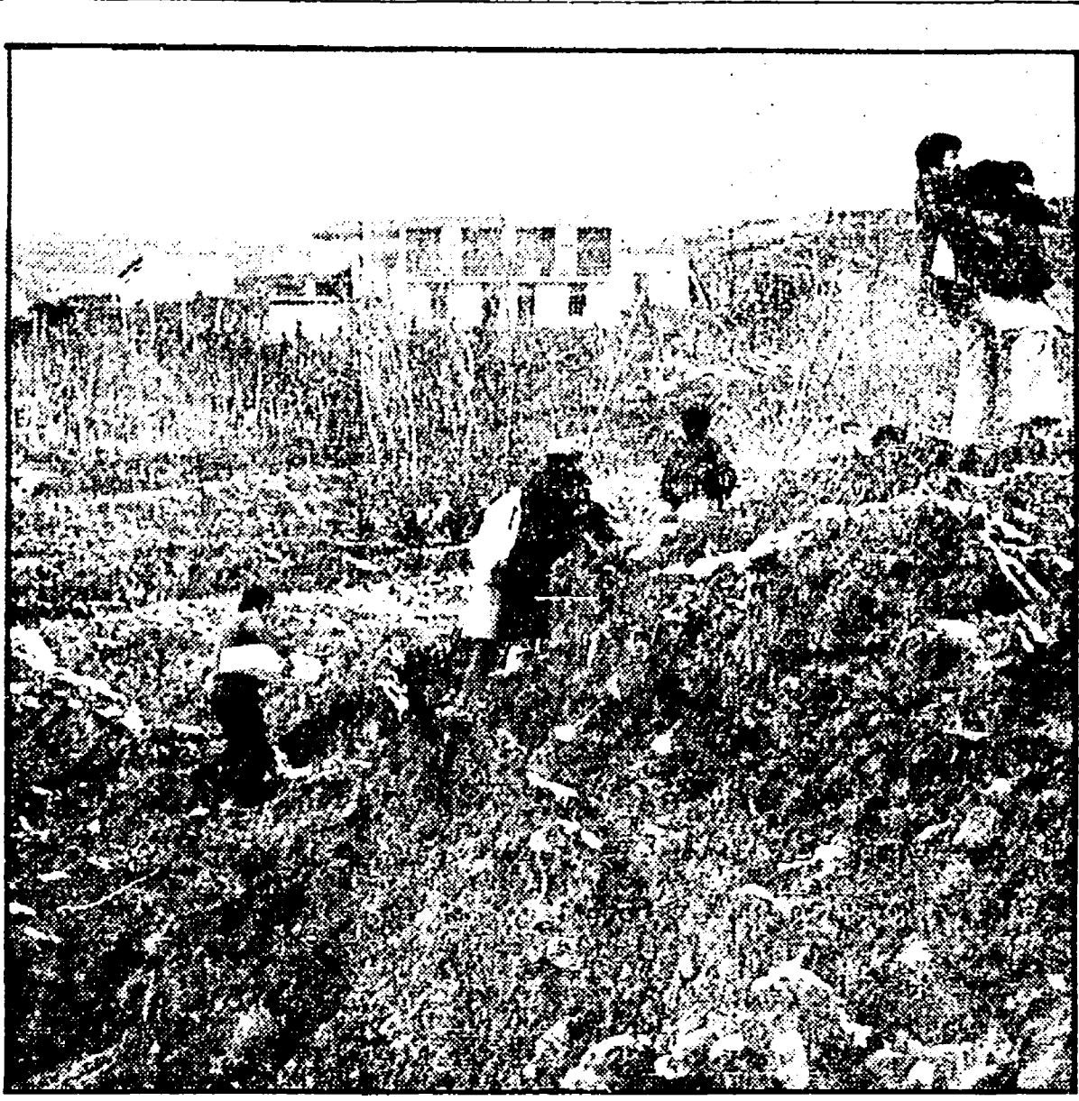
Giarrossa, uno dei tanti paesi lucani disastrati dalle continue frane del terreno

Come ogni anno le calamità naturali provocano disastri in tutta la regione