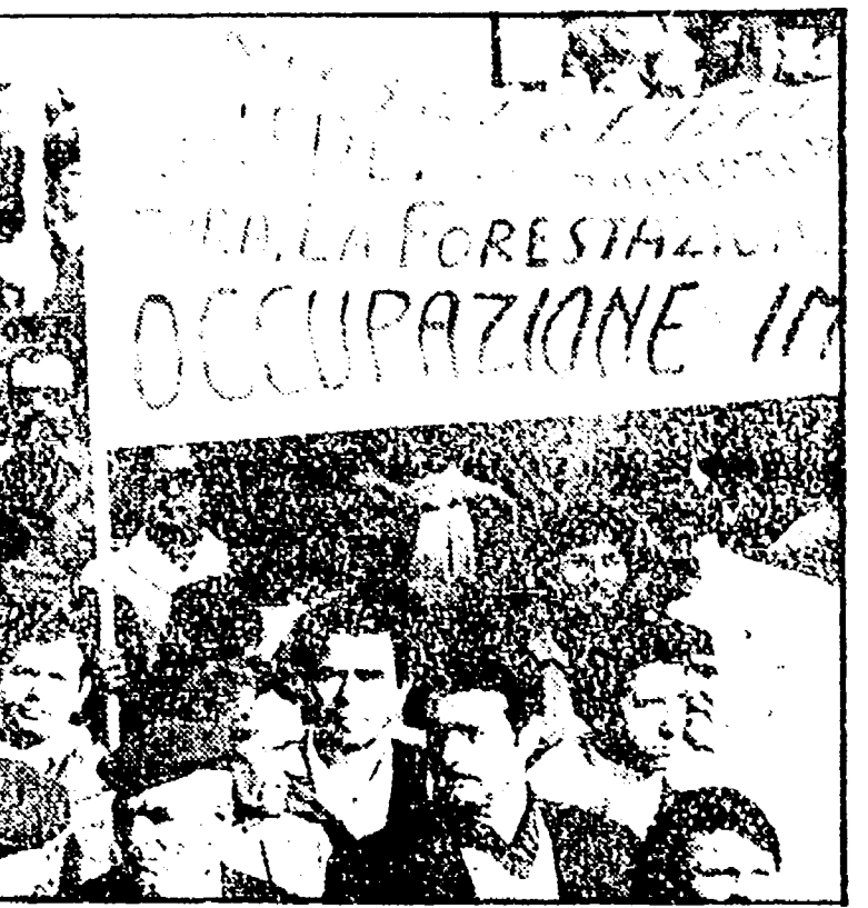
Due immagini di un grande sciopero generale a Nuoro