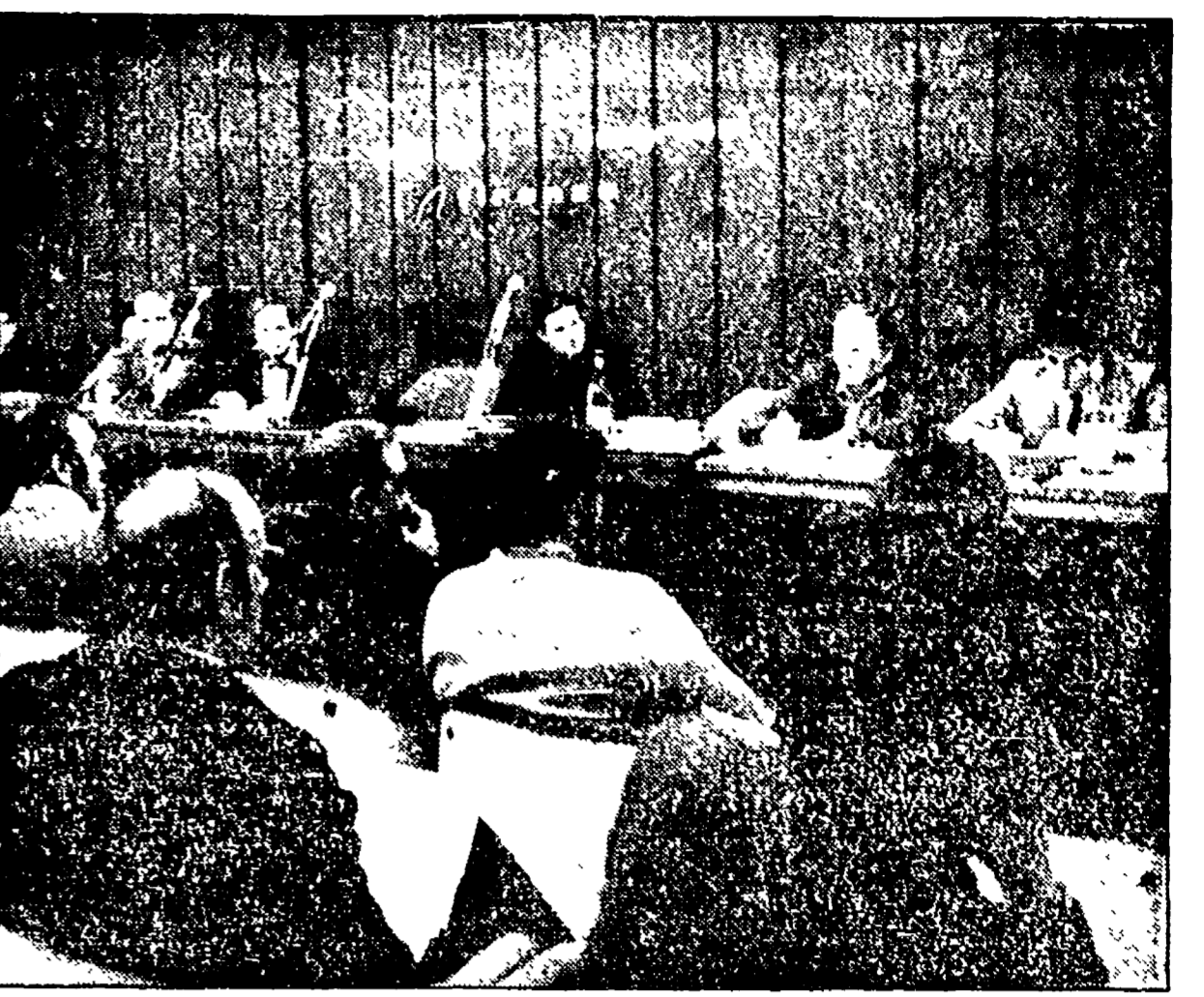
Un momento del Consiglio regionale dei quadri della CGIL svoltosi al Palazzo del Congresso