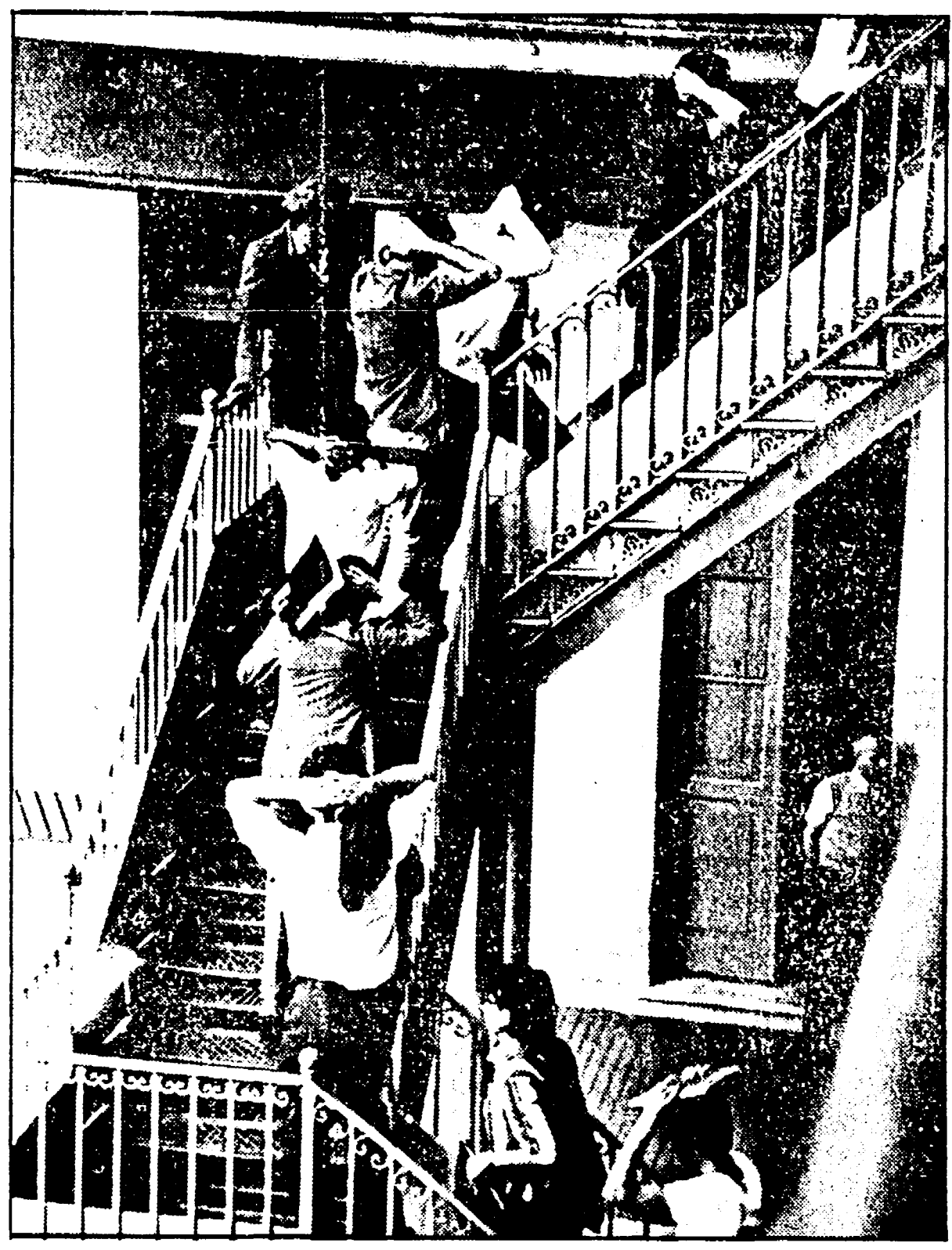
Studenti fermati dalla polizia a Rio de Janeiro

Durante la campagna elettorale Carter non ha ignorato la Colombia di cui si è candidato da un importante ruolo di osservatore e di mediatore. Il suo intervento è stato visto con interesse dalla CIA. Lo ha fatto in nome del liberalismo democratico, moderato e pragmatico, che si è sempre opposto al progetto di un regime autoritario e antidemocratico. Ma non si è mai opposto a un regime autoritario e antidemocratico.