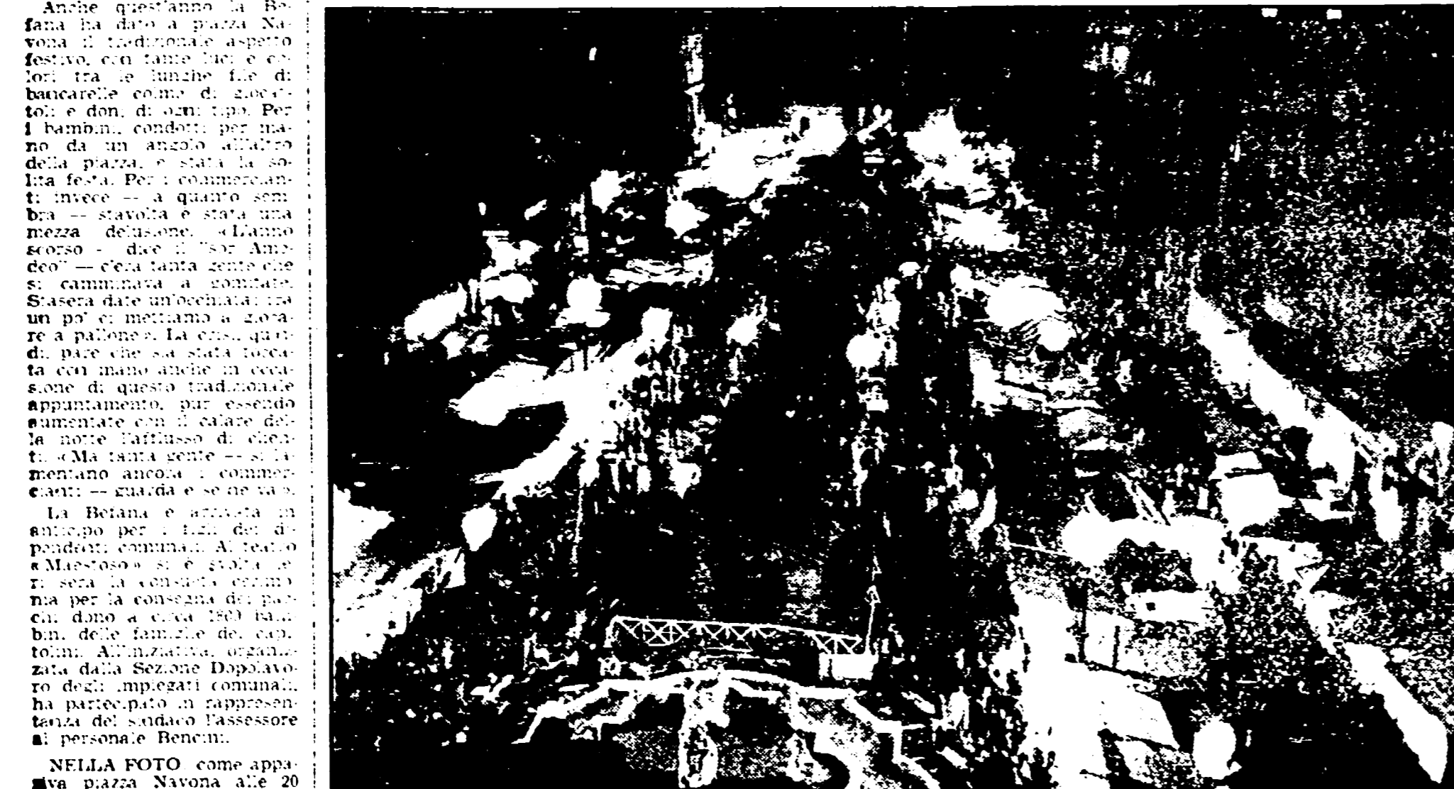
NELLA FOTO: Befana come appare a piazza Navona alle 20 di ieri sera.