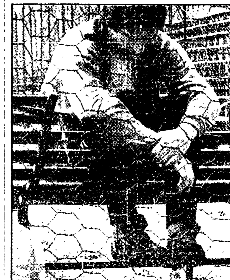
L'ala biancazzurra, che forse giocherà, si sfoga

Gli arbitri di oggi (ore 14,30) Bologna-Inter: Ciacci; Catanzaro-Foggia (c.n. Reggio Calabria): Bergamo; Genova-Cesena: Maffei; Lazio-Roma: Trinchieri; Napoli-Juventus: Manicucci; Perugia-Fiorantina: Prati; Roma-Sampdoria: Carrarin; Torino-Lazio: Gussone.