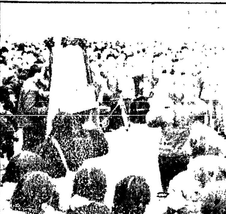
PECHINO - Un momento della manifestazione per Ciu En-lai

Per la manifestazione in onore di Ciu En-lai decine e forse centinaia di migliaia di persone sono sfilate sulla piazza Tien An Men