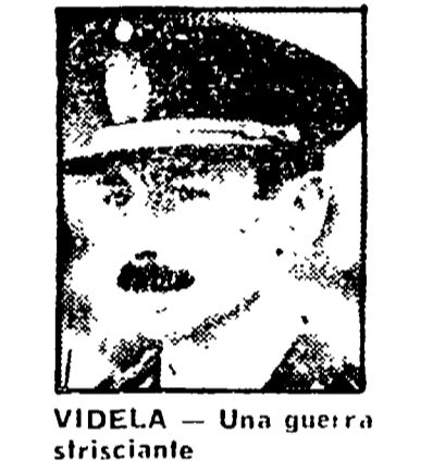
VIDELA - Una guerra strisciante