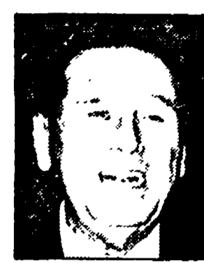
PERON - Un volto non colmato