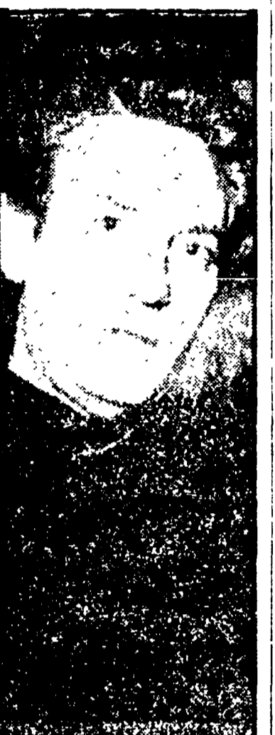
LOS ANGELES, 15. L'attore Peter Finch, scomparso il 14 gennaio.

Los Angeles, 15. L'attore Peter Finch, scomparso il 14 gennaio, è stato sepolto a Hollywood. Finch era un attore di grande successo, noto per il ruolo di James Earl Ray in 'Papaveri e papaverine'. La sua scomparsa è stata una grande perdita per il mondo dello spettacolo.