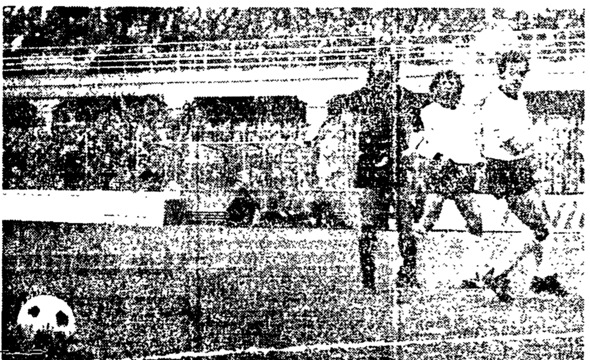
MILAN-CESENA - Due immagini dello 0-0 di San Siro: nella foto in alto Boragna anticipa Silva, sotto Calloni calcia clamorosamente a lato, sprizzando una favorevolissima occasione

MILAN. Mirotic, 6. Angui 6. Mullaev, 6. Verri 5. Bert, 6. Turone 5 (lari 5). Geronzi, 5. Rivera 6. Capello 6. Calloni 5. Biasoli 5. Silva 5. CESENA. Boragna 6. Benedetti 6. Cecarelli 6. Boattieri 6. Uboldi 6. Fera 7. Bittolo 5. Pepe 6. De Ponti 5 (Plangelli 4 del 14 s.l.). Valentini 5. Vercanella 5. VIKTORO. Benedetti di Roma.