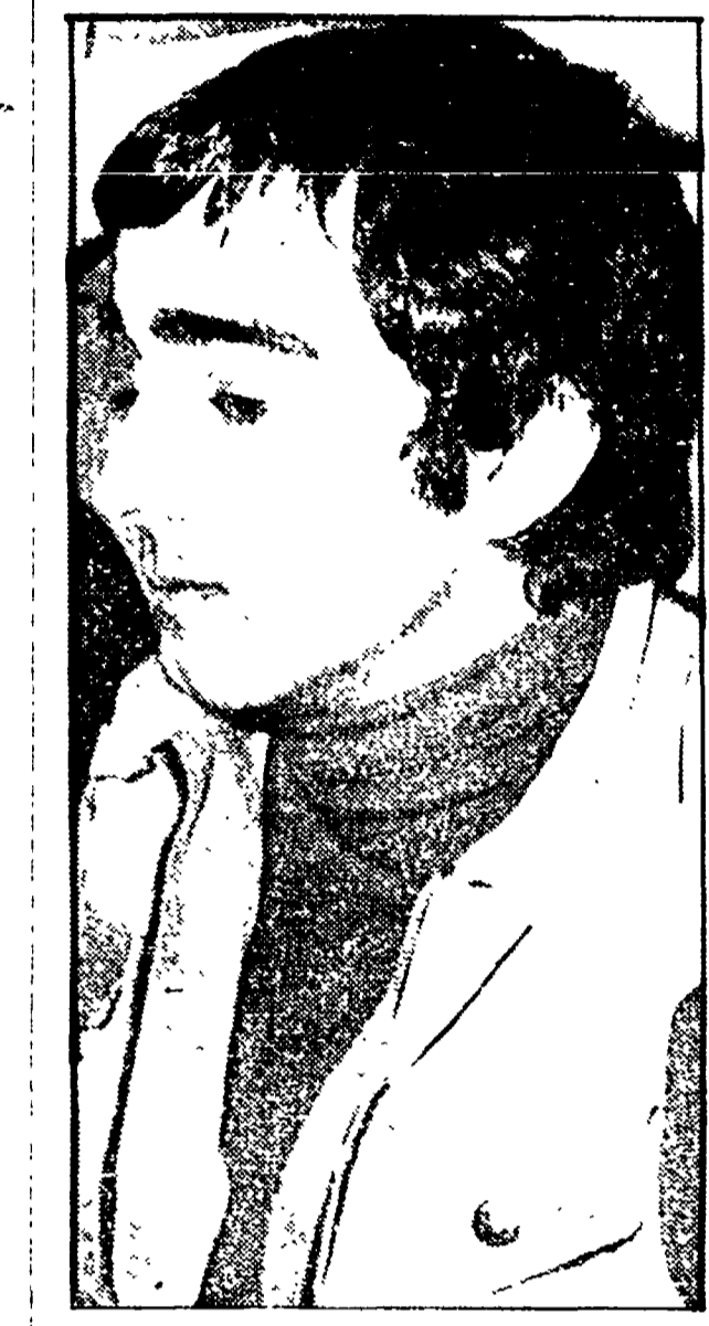
Claudio La Neve, assassino di Vittoria Fornari

Assemblee dibattite, scioperi, cortei e sfilate: domani, 10 febbraio, nella città di Roma, una giornata di mobilitazione studentesca. Le organizzazioni studentesche si sono riunite per discutere le modalità di partecipazione alla manifestazione. Il corteo partirà alle 9,00 dall'Esedra e si dirigerà verso il ministero della Pubblica Istruzione. I partecipanti saranno circa 10.000. Durante il corteo, i studenti discuteranno delle loro rivendicazioni e delle loro proposte. La manifestazione è organizzata dal Comitato promotore per la difesa dell'ordine democratico.