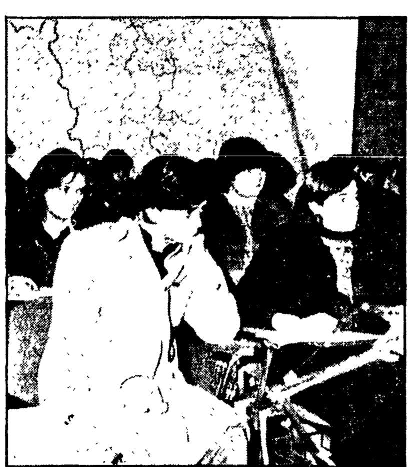
GLI ALUNNI «INTERROGANO» I CONSIGLIERI REGIONALI

L'incontro con rappresentanti di CGIL-CISL-UIL, parlamentari, esponenti degli enti locali - Critiche al progetto Cossiga