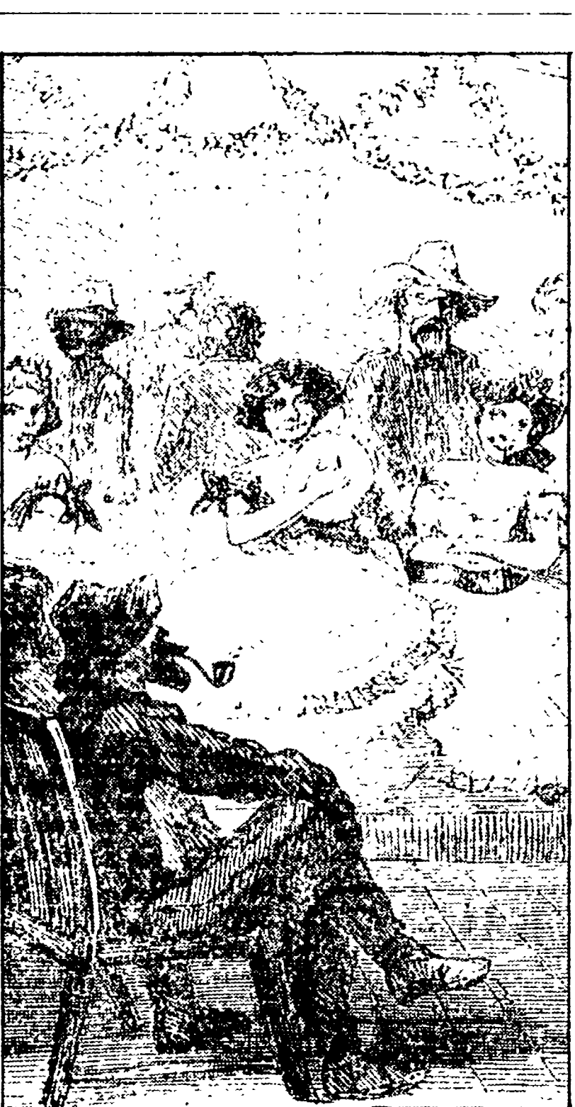
Una stampa del vecchio West. E' una delle illustrazioni del nuovissimo libro...