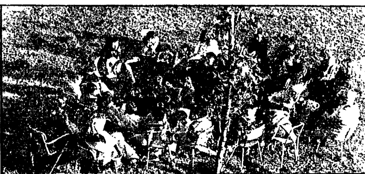
Un tempo pieno si incontra anche la musica

I cinque centri d'attività di Pistoia: la biblioteca, il museo, il cinema, la musica, lo sport - Un « tempo pieno » per esplorare la realtà esterna alla scuola