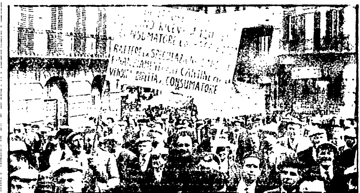
Dai nostri corrispondenti