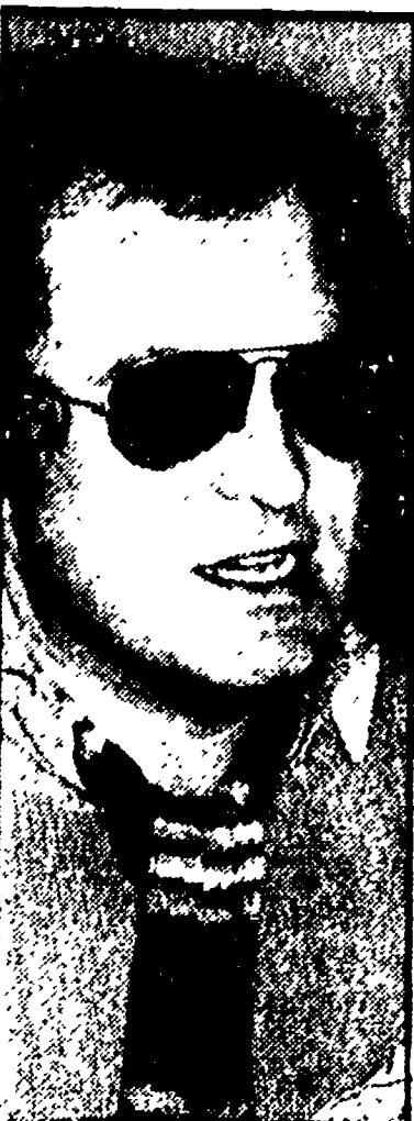
Bernardo Bertolucci durante la conferenza stampa