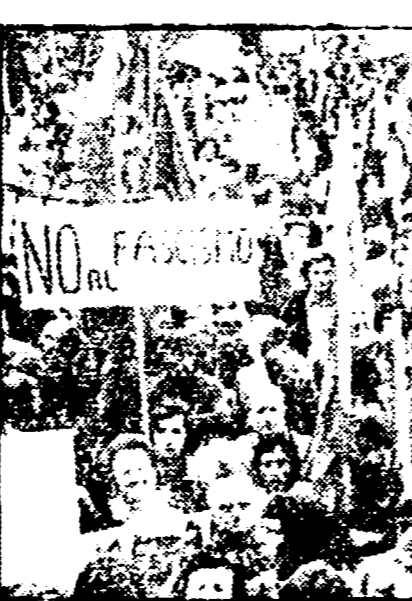
Una manifestazione giovanile antifascista a Pesaro

Una attenta riflessione per capire i caratteri nuovi della protesta giovanile. Impegno unitario di tutto il partito - Conclusioni del compagno Verdini