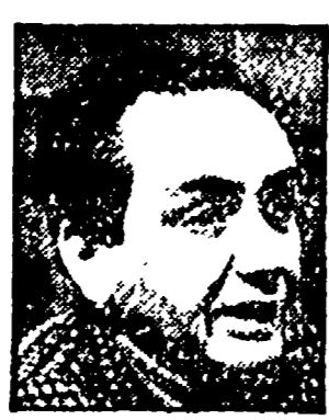
ROSSITTO - Verificare le «doppie»